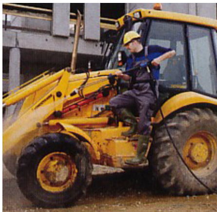
Hochdruckreiniger Kaltwasser / Heißwasser