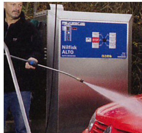
Hochdruckreiniger stationär Heißwasser