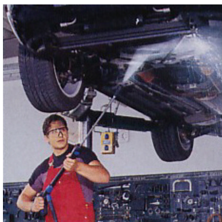
Bremsen- und Teilwäscher